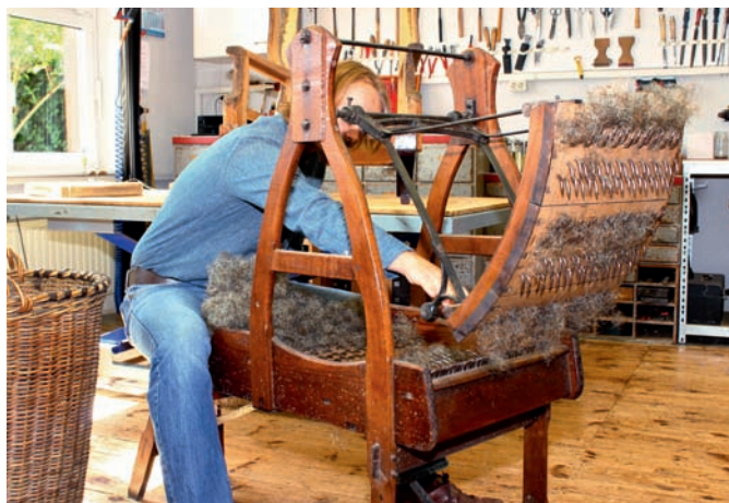
Kein Museumsstück, sondern tägliches Arbeitsgerät: Die Cardeuse aus dem 19. Jahrhundert ist immer im Einsatz

Mit Schnittmodellen für nahezu jede Verarbeitungsstufe wird die aufwendige Arbeitsweise verdeutlicht. Jeder Kunde erhält zudem eine Fotodokumentation seines Auftrags