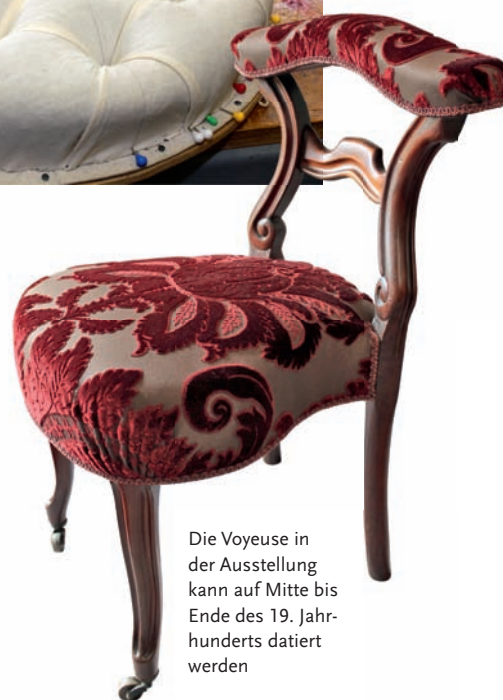
Die Voyeuse in der Ausstellung kann auf Mitte bis Ende des 19. Jahrhunderts datiert werden